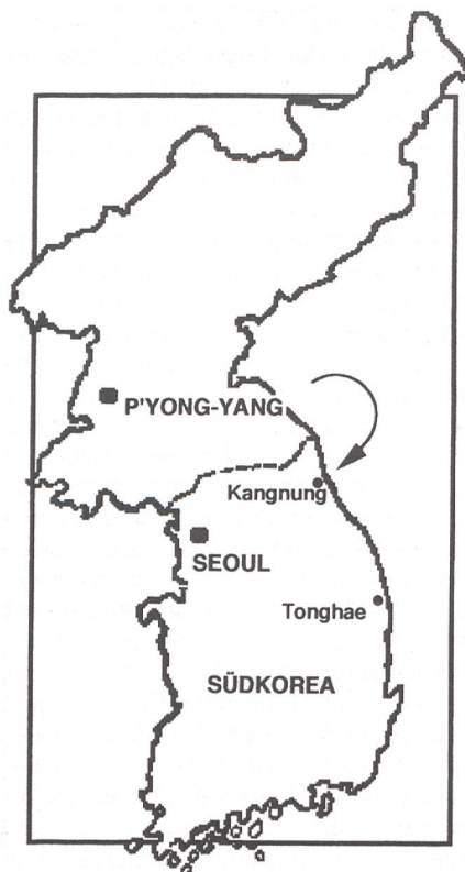
In der Nähe von Kangnung strandete das nordkoreanische Klein-U-Boot. Der Pfeil zeigt den ungefähren Kurs.

an. Nach der erfolgten Aufnahme hatte er vor, noch in der gleichen Nacht zuerst wieder die internationalen Gewässer zu erreichen, um anschliessend einen nordkoreanischen Hafen an der Ostküste anzulaufen. Aus unbekannten Gründen lief das Klein-U-Boot aber auf Grund. Alle Versuche des Kapitäns, das Unheil abzuwenden, scheiterten. Das Boot drehte sich während der Versuche, immer mehr und sass schliesslich ganz fest. Ausserdem brach während einem der Befreiungsversuche die Antriebschraube ab. Um sich der Festnahme durch die südkoreanische Armee und Polizei zu entziehen, wurde entschieden, das Klein-U-Boot aufzugeben. Die Agenten und die Crew – alles Offiziere – verliessen das U-Boot. Nichts sollte dem Gegner in die Hände fallen. Deshalb versuchten sie, das Innere des U-Bootes, wenn nicht zu vernichten, so wenigstens für eine Auswertung unbrauchbar zu machen.