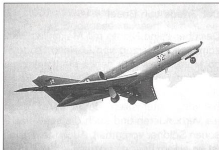
Dassault Falcon 10 MER der französischen Flotte