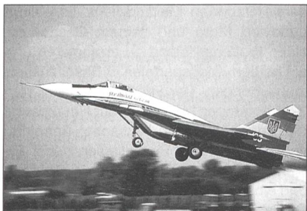
Mikoyan & Gurevich MiG-29 Fulcrum der ukrainischen Luftwaffe