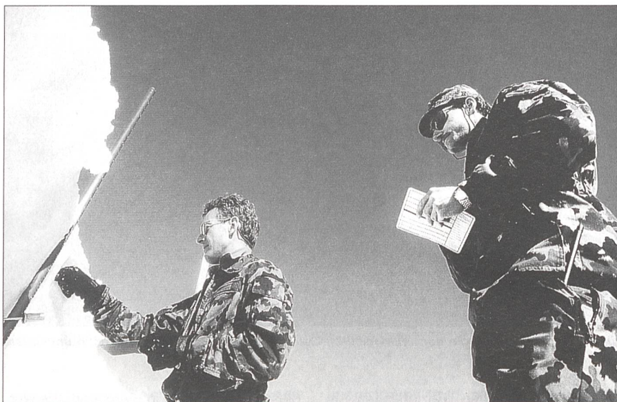
Arbeit im Gelände: Untersuchung der Schneedecke und Beurteilung der Lawinengefahrensstufe.

Der diesjährige Fortbildungsdienst der Truppe (FDT) des militärischen Lawindienstes fand im März im Gotthardgebiet