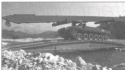
Der Brückenpanzer 68/88 (Brü Pz 68/88)

Aus diesem Grund werden den mechanisierten Verbänden Genietruppen unterstellt, welche mit Brücken- und Entminungsmitteln ausgerüstet sind. In unserer Armee stellen die Pansersappeurkompanien im Geniebataillon der Panzerbrigade die Bewegungsfreiheit sicher. Das Geniebataillon verfügt über eine Stabskompanie, eine Tech-Kompanie und drei Pansersappeurkompanien. In den Pansersappeurkompanien sind je zwei Brückenpanzer 68/88 eingeteilt, und dieses Fahrzeug möchte ich etwas genauer vorstellen.