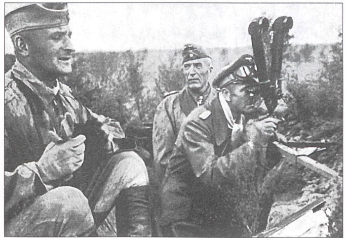
Generaloberst Paulus (am Scherenfernrohr), der Verteidiger im Kessel von Stalingrad.

raden zum Tode verurteilt wurden, erklärte sich Paulus bereit, für die sowjetische Propaganda zu arbeiten und als Mitglied des Nationalkomitees «Freies Deutschland» mit Radioaufrufen die Verbrechen von Hitler und dessen Regime aufzuzeigen und die kämpfenden Truppen zum Überlaufen zu bewegen. Am Nürnberger Kongress trat er als Zeuge auf. Aus der russischen Gefangenschaft im Jahre 1953 entlassen, liess er sich in der sowjetischen Besatzungszone von Deutschland nieder, griff öffentlich die Bestrebungen der westdeutschen Regierung zur Wiederbewaffnung der BRD an und kritisierte deren amerikafreundliche Politik.