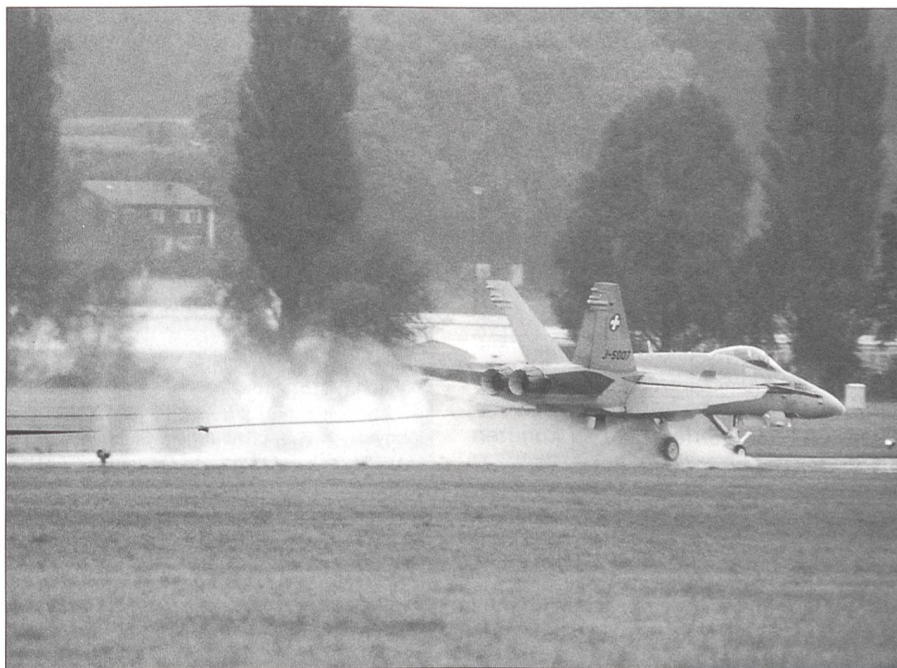
Die F/A-18C J-5007 demonstrierte eine Hakenlandung bei der in Dübendorf neu installierten Kabelfanganlage.

koptertypen wie F/A-18, F-5 Tiger, Mirage IIIS+RS, PC-6, PC-7, PC-9, Alouette 3 und Super-Puma, bis zur Tätigkeit der Flugsicherung an den Radarschirmen im Kontrollturm, konnten besichtigt werden. Die Piloten des Überwachungsgeschwaders der Fliegerstaffeln 1 und 11 waren ebenfalls mit Ständen anwesend und gaben gerne Auskunft über ihre Aufgaben. Grosse Aufmerksamkeit zogen die zwei F/A-18-Flugzeuge auf sich, die nach einem Einsatz eine Hakenlandung bei der in Dübendorf neu installierten Kabelfanganlage demonstrierten und innerhalb von 150 Metern zum Stillstand kamen.