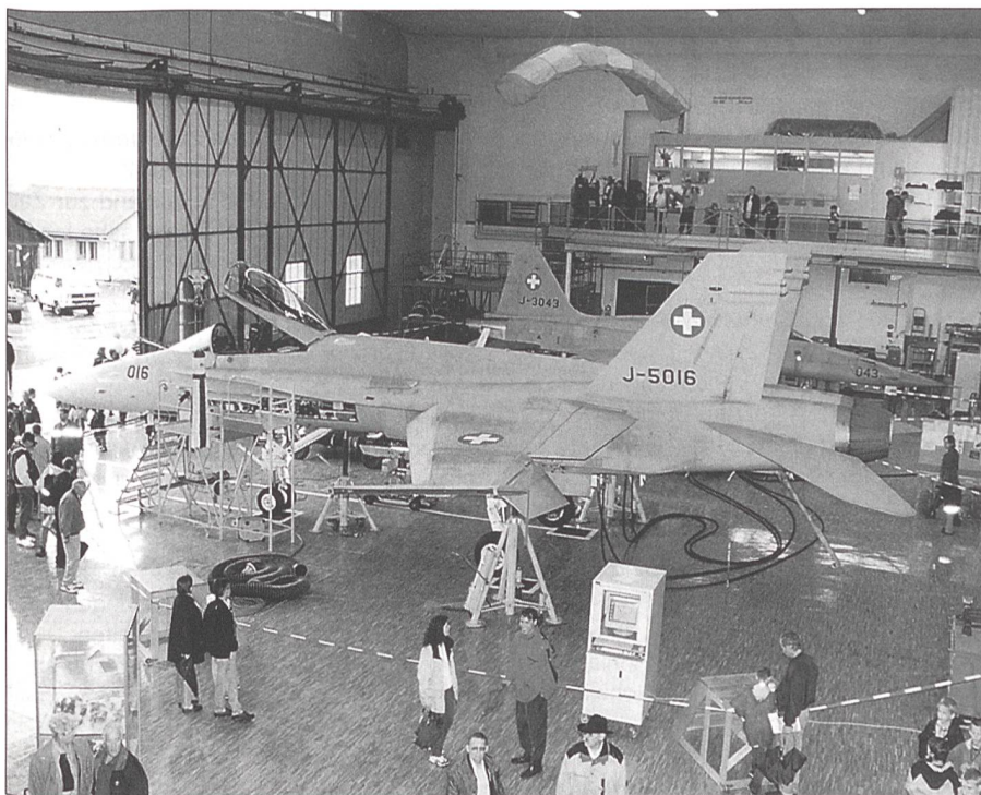
Der Bevölkerung wurde die Gelegenheit geboten, hinter die Kulissen des Militärflugplatzes zu blicken; hier eine F/A-18 auf dem Prüfstand.

Zur Vergünstigung von Materialtransporten können die Landwirte der Bergzone I-IV bei der Schweizer Berghilfe um eine Kostenbeteiligung nachfragen. Ein eventueller Beitrag wird nach Eingang der Offerte oder nach Vorliegen der Rechnung festgelegt. Die Schweizer Berghilfe und die Rega können nur Transporte mitfinanzieren, welche durch die gemeinsame Einsatzleitung (Tel. 01 651 00 11) organisiert wurden. Zusätzlich werden nur Kosten durch die Schweizer Berghilfe übernommen, welche nicht durch eine Versicherung oder die öffentliche Hand bezahlt werden.