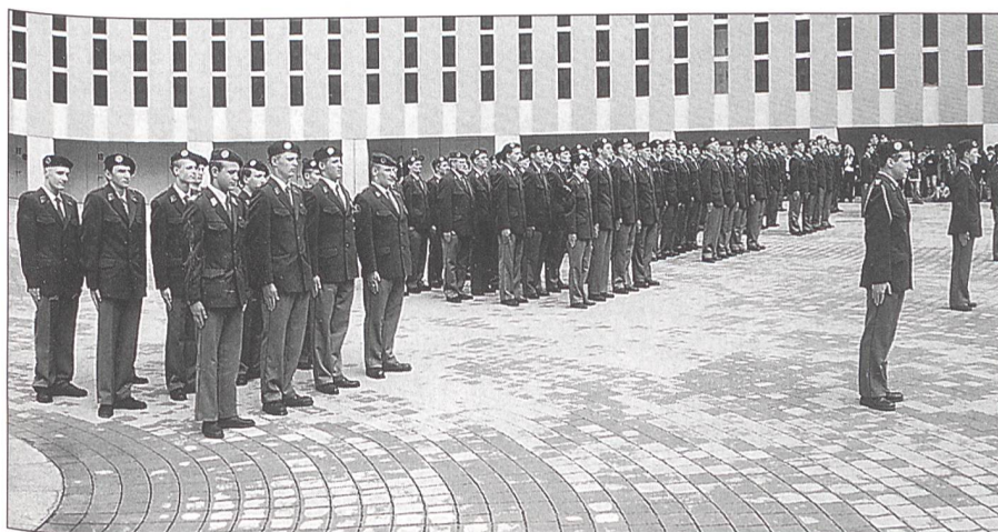
Am Ende des Besuchstages Hauptverlesen und Abtreten in den verdienten Urlaub.

Es giesst unaufhörlich. Die nahen Berggipfel noch verhangen mit regenschweren Wolken. Trotzdem wollen die Eltern, Geschwister, Freundinnen, sie alle sind da, dem Sohn, Bruder und Freund mit ihrem Besuch eine Freude machen. Möchten hautnah, wenigstens an diesem Tag, das «Soldatendasein auf Zeit» miterleben. Nach den verschiedenen gekonnten Vorführungen des in nur sieben Wochen bereits angelernten militärischen Handwerks, wobei «Action» und auch ein wenig «Bluff» erlaubt waren. Dann Retablieren, Duschen, Mittagessen und Abtreten in den verdienten grossen Urlaub. Mittlerweile hat sich das Wetter gebessert. Die wärmende Sonne, der jetzt tiefblaue Himmel gaben dem Tessin wieder einmal zu Recht die Bezeichnung «Sonnenstube».