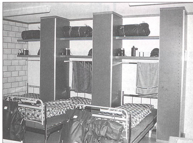
Zimmer mit 6 Betten; vorn am Bettgestell wird die Trageinheit aufgehängt.

liegenden Stadt Horgen. Fourier Michele Casoni aus Bellinzona meint: «Am morgigen Angehörigen-Besuchstag müssen mehrere hundert Mittagessen zubereitet werden.» Mit 6.40 Franken pro Mann und Dienstag für drei Mahlzeiten und Zwischenverpflegung kommt Fourier Casoni einigermaßen zurecht. «Da könne er schon mal ein üppigeres Menü mit Dessert aufischen. Der Kalorienbedarf pro Tag sei übrigens reglementiert: Für leichte Tätigkeit könne er pro 2300, für normale 3000 und für schwere Tätigkeit 4000 kalorienhaltige Verpflegung kochen lassen.