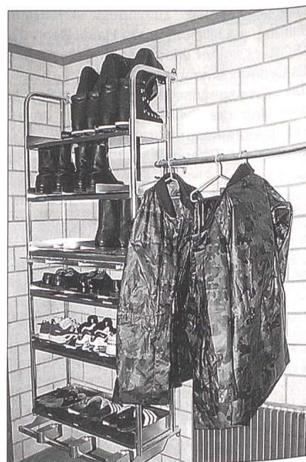
Jedes Zimmer verfügt im Gang über eine Einrichtung für Schuhe, nasse Kleider und Waffe, natürlich ohne Magazin und gesichert.

Die Kaserne bietet Platz für zwei Kompanien (Kp) mit Kader, gesamthaft 258 Betten, verteilt auf drei Stockwerke. Jede Kp bewohnt einen Flügel, verfügt über eigene Magazine, Küche, Esssaal, Mehrzweckraum mit Radio und Videoeinrichtung, separate Zimmer für Offiziere, Instruktoren und höhere Unteroffiziere, Waschräume, WCs. Ferner getrennte Duschräume für das Kader und für die Rekruten, Mehrzweckräume in der obersten Sektion und einen Aufenthaltsraum für die Wache sowie einen Aufzug für Transporte. Die spar-