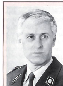
Oberst im Generalstab Pierre-André Champendal (47)

Der Schulkommandant – ein Berufsoffizier im Range eines Obersten oder Oberstleutnants – ist der Vorgesetzte aller Angehörigen einer Rekrutenschule und dem Ausbildungschef seiner Truppengattung unterstellt (z. B. Infanterie, Übermittlungs- oder Versorgungstruppen). Zum militärischen Lehrkörper gehören die Instruktionsoffiziere und -unteroffiziere. Die Berufsoffiziere stellen die Ausbildung der Truppe sicher und schulen die Kader in