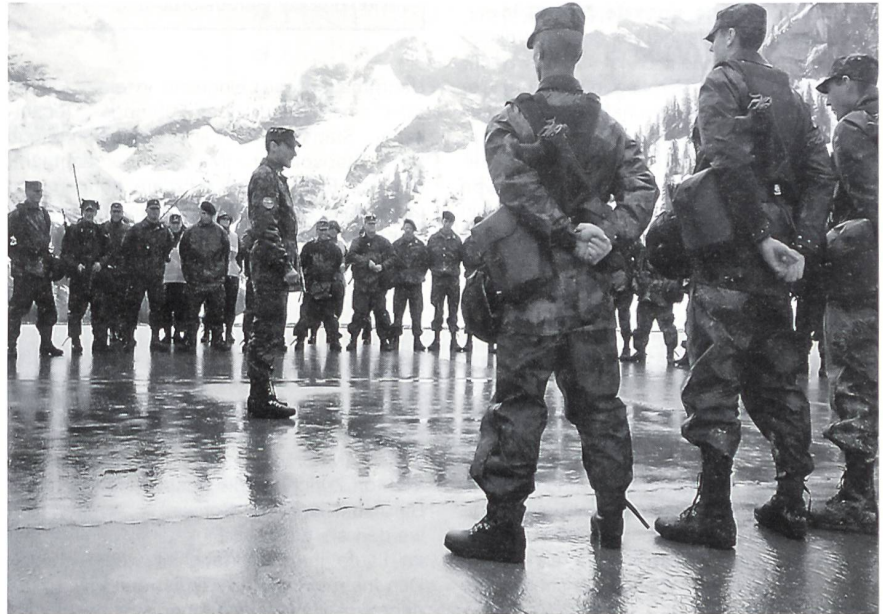
Übungsbesprechung nach einem Gefechtsschiessen der Mechanisierten Infanterie-Rekrutenschule auf dem Schiessplatz Hongrin VD.

Die mehr als 3600 Miliz-Vorgesetzten in den Frühjahrs-Rekrutenschulen bestanden aus zirka 2600 Korporalen (Gruppenführer), über 400 Leutnants (Zugführer), rund 180 Subalternoffizieren (Oberleutnant und einzelne