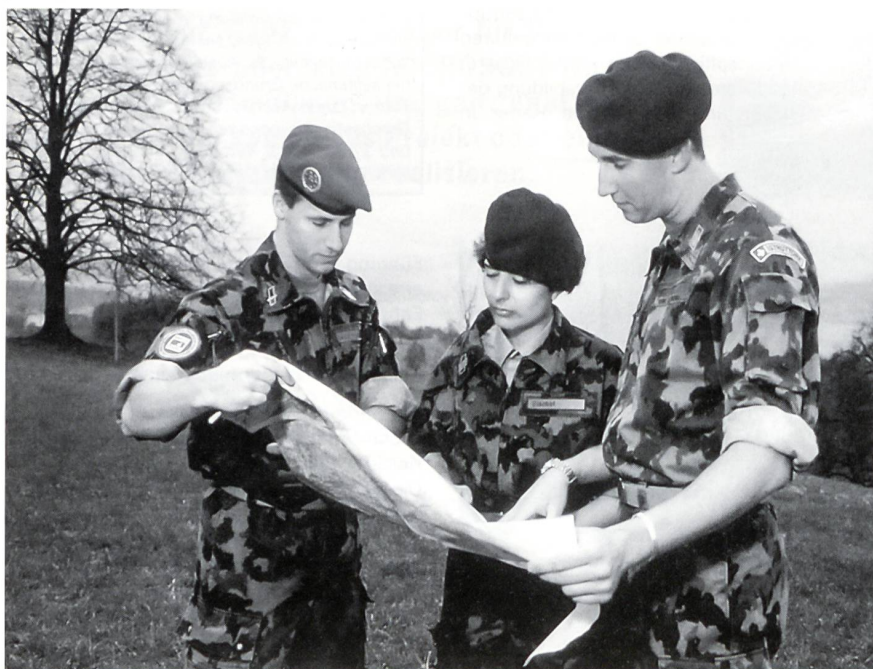
Gemischte Ausbildung auch an der Militärischen Führungsschule (MFS) in Au (bei Wädenswil ZH): Angehende Berufsoffiziere bei einer Übungsvorbereitung.

«Junge Korporale werden in der Ausbildung zum höheren Unteroffizier – Fourier oder Feldweibel – auf eine Funktion vorbereitet, deren Verantwortung auf Stufe militärische Einheit liegt, sei es als Rechnungsführer oder als Organisator. Die Fourier- und Feldweibel-Anwärter stehen meistens am Anfang ihrer beruflichen Laufbahn. Somit übernehmen sie in der Regel, verglichen mit dem Zivilleben, im Militär bereits eine höhere persönliche Verantwortung.»