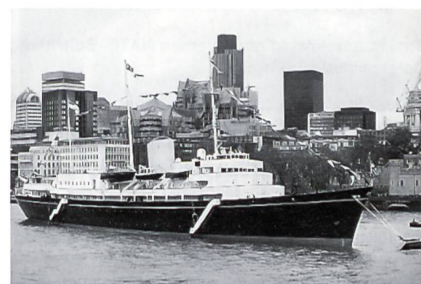
«HMY Britannia» bei ihrer Abschiedstournee vor dem Tower in London.

Während der 44 Jahre seit ihrer Indienststellung fuhr die «Britannia» beinahe 1,1 Mio. Seemeilen (über 2 Mio. km, über fünfmal die Entfernung Erde-Mond) und absolvierte 697 Staatsbesuche mit Mitgliedern der königlichen Familie an Bord. Allein in ihrem letzten Dienstjahr wurden 32 400 Seemeilen ins Logbuch der königlichen Jacht eingetragen, ein grosser Teil davon bei ihrer Reise nach Fernost, die mit der Ausfahrt aus Hongkong in der Nacht der Übergabe der ehemaligen Kolonie an China gipfelte. Doch auch für Englands Wirtschaft ist die Reise äusserst