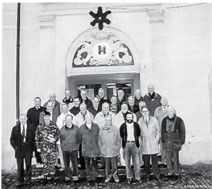
Das Bild zum Jubiläum «Genisten von heute» vor dem Kasernen Eingang von vorgestern, das heisst von 1856.

Als Brugg 1847 offiziell Waffenplatz der Pontoniere wurde, bezog sowohl die Mannschaft wie auch das Kader Unterkunft in Privathäusern. Erst auf Verlangen einer Ortsbürgerversammlung liess der Kanton Aargau 1856 das in der Hofstatt liegende Kornhaus in eine Kaserne umbauen. Im Dachgeschoss dieses Gebäudes, das seit vielen Jahren Domizil der Industriellen Betriebe der Stadt Brugg ist, konnten die