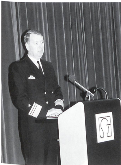
Admiral Frank, Stv des Generalinspektors, anlässlich der Kongresseröffnung.

haus in Koblenz, was auch einen kleinen Spaziergang, respektive eine -fahrt durch die Stadt erlaubte.