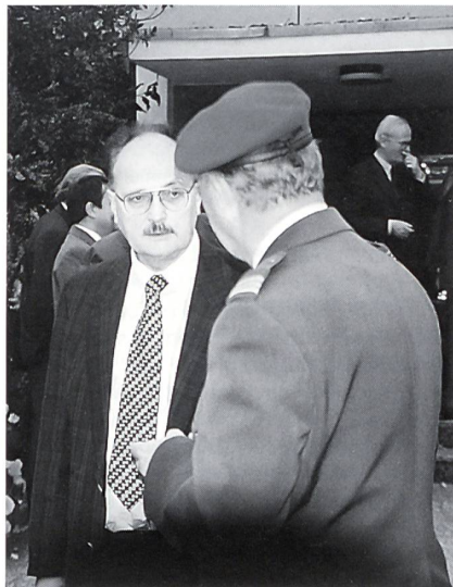
In angeregtem Gespräch... der Genossenschaftspräsident und sein Chefredaktor.

Die Abteikirche Maria Laach hiess ursprünglich Abbatia S. Mariae ad Lacum, Abtei der heiligen Maria am See, einfach «Laach» genannt und liegt in einer phantastisch schönen Landschaft. Das Laacher Seegebiet erhielt erst seine Bedeutung, als der Pfalzgraf Heinrich II. aus dem Hause Luxemburg-Gleiberg mit seiner Gemahlin Adelheid von Orlamünde im Jahre 1093 den Plan fasste, hier eine Benediktinerabtei ins Leben zu rufen. Viele ruhige und auch bewegte Jahre sind seither vergangen, im Jahre 1802 wurde das Kloster sogar aufgehoben als Folge der französischen Revolution. Erst seit 1892 leben wieder Benediktiner im Kloster, und heute sind es rund 70, die dort beten und arbeiten. In einem interessanten Film kann man sich den Klosteralltag anhand eines Tagesablaufes vorzeigen lassen. Bei unserem Besuch hatten wir im weiteren Gelegenheit, an einer Vesper teilzunehmen, ein eindrückliches Erlebnis, welches