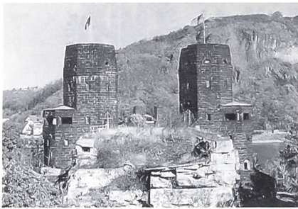
Die Brücke von Remagen

lang, ihre lichte Höhe über dem normalen Wasserstand des Rheines betrug 14,80 m, und der höchste Punkt des Bogens betrug 29,25 m. Die Brücke trug zwei Eisenbahngleise und einen Fussgängersteg. Sie galt als eine der schönsten Stahlbrücken über den Rhein.