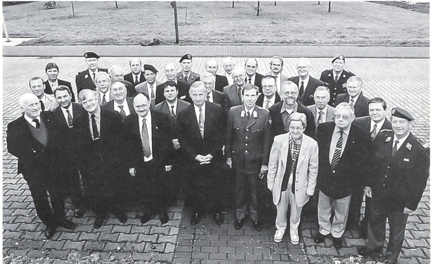
Fototermin für die Kongressteilnehmer auf der Hardthöhe, Bonn, Bundesministerium der Verteidigung.

Nach der Anreise am Samstag, 18. Oktober 1997, gab es ein frohes Wiedersehen mit alten Bekannten und ein Kennenlernen von neuen EMPA-Mitgliedern. Gleich am ersten Abend fand ein Empfang statt im Alten Rat-