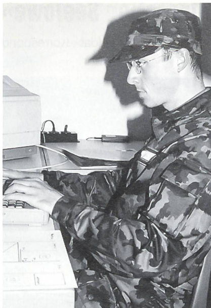
Erstellung des Zeitungs-Layouts.

Für das Informationsregiment gibt es keine Kursrhythmen wie in der übrigen Armee. Fast jedes Jahr leisten Offiziere, Unteroffiziere und Soldaten einen Dienst von einer Woche oder einmal zehn Tagen. Meistens zieht der Angehörige einer Medienkompanie die Uniform an, rückt ein und übernimmt im Militärdienst die gleiche oder ähnliche Tätigkeit wie im Berufsleben. Die Grenzen liegen bei den total zu leistenden dreihundert Diensttagen für die Soldaten. Der Bundesrat entscheidet zB bei einer Krise, wann und wieviel vom Rgt für die Erfüllung einer Informationsaufgabe notwendig sind. Im Katastrophenfall können für besondere Aufgaben der Orientierung Einsätze pikettartig aufgegeben werden. Sie wären innert wenigen Stunden zB beim Radio einsatzbereit. Das Rgt verfügt über eine gros-