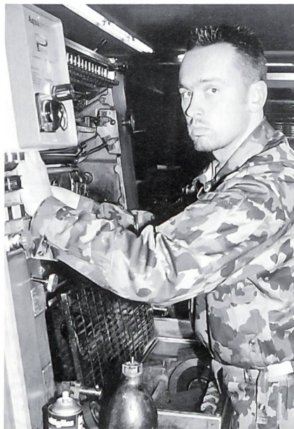
Steuerung der Druckereimaschinen.

Schon drei Stunden nach der Befehlsausgabe in Bern meldet sich das «unter Fels» geschützte Radio Schweiz mit einer Nachricht