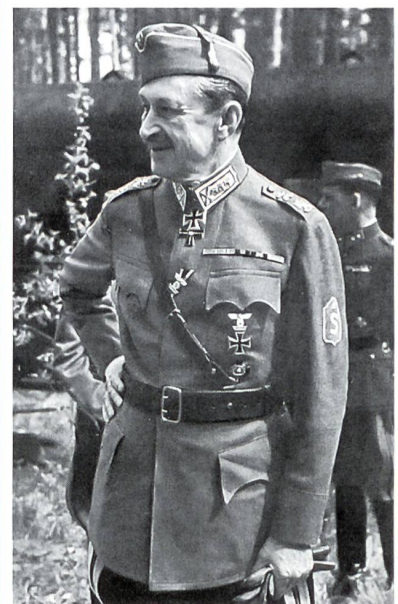
Die Aufnahme stammt aus der deutschen Propagandazeitschrift «Signal» (2. Oktober-Heft 1942).