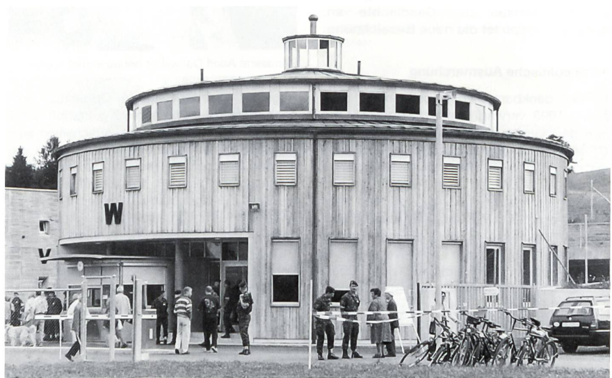
Das imposante Wachgebäude.