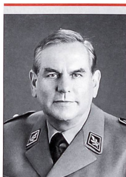
Zentralpräsident der Schweiz. Offiziersgesellschaft im Range eines Brigadiers.

Es ist absehbar, dass nicht bei der Verwaltung, sondern primär bei der Truppe eingespart wird. Die Rahmenbedingungen für die Ausbildung verschlechtern sich dadurch. Die Ausbildung gestaltet sich dann