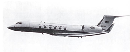
Das neueste VIP-Flugzeug der USAF: C-37A, besser bekannt unter der Bezeichnung Grumman Gulfstream.