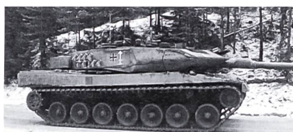
Leopard 2 A5

Im nächsten Waffenquiz werden moderne Kampfpanzer zu erkennen sein. Dazu gehören sicher die Typen M1 Abrams, Challenger, Leclerc, T72 und T80 sowie der Leopard 2. Besonders erwähnt sei der Leopard 2 A5. Diese kampfwertgesteigerte Version kommt dank ihrer Zusatzpanzerung in leicht anderer Aufmachung daher als gewohnt (siehe Bild).