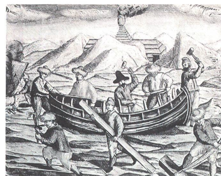
Vorbereitung zur Rückfahrt im offenen Boot: Die Wände werden aus Planken des aufgegebenen Schiffes erhöht.

In zwei offenen Booten traten die Überlebenden die Rückfahrt an. In einem war Barents, bereits schwer von Krankheit und Tod gezeichnet, im andern Heemskerck. Am fünften Tag der Fahrt nach Süden starb Barents am