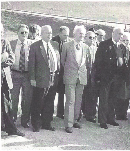
Der Präsident der Genossenschaft

üblen Attacken des amerikanischen Senators D'Amato, denen dann weltweit eine eigentliche Diffamierungskampagne gegen unser Land folgte. Haben wir das verdient? stellt sich die Frage, und Herdener gibt die Antwort gleich selber: «Zum Teil, leider ja». Der Bundesrat und die Schweizer Banken hätten das üble Spiel der Rundumschläge von D'Amato allzu lange unterschätzt. Statt dass der Bundesrat dessen Anschuldigungen von Anfang an fest und bestimmt zurückgewiesen hätte, hat er sich nach allen Seiten unterwürfig entschuldigt. «Seit kurzem», so Herdener, «können wir mit Befriedigung feststellen, dass der Bundesrat seine Führungsaufgabe besser wahrnimmt. Der erste Teil der Ansprache von Bundespräsident Koller vor der Vereinigten Bundesversammlung war eine würdige und staatsmännische Rede», betonte der Präsident der GMS.