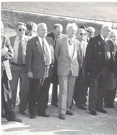
Der Präsident der Genossenschaft

üblen Attacken des amerikanischen Senators D'Amato, denen dann weltweit eine eigentliche Diffamierungskampagne gegen unser Land folgte. Haben wir das verdient? stellt sich die Frage, und Herdener gibt die Antwort gleich selber: «Zum Teil, leider ja». Der Bundesrat und die Schweizer Banken hätten das üble Spiel der Rundumschläge von D'Amato allzu lange unterschätzt. Statt dass der Bundesrat dessen Anschuldigungen von Anfang an fest und bestimmt zurückgewiesen hätte, hat er sich nach allen Seiten unterwürfig entschuldigt. «Seit kurzem», so Herdener, «können wir mit Befriedigung feststellen, dass der Bundesrat seine Führungsaufgabe besser wahrnimmt. Der erste Teil der Ansprache von Bundespräsident Koller vor der Vereinigten Bundesversammlung war eine würdige und staatsmännische Rede», betonte der Präsident der GMS.