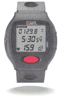
Polar Accurex Plus™