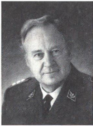
Korpskommandant, Generalstabschef der Schweizer Armee seit dem 1.1.1993

Auf Jahresende treten sieben hohe Offiziere ins zweite Glied zurück, denen auch der «Schweizer Soldat» für die geleistete Arbeit danken möchte. Während Jahren standen sie an verantwortungsvollen Posten und stellten ihre Kraft und ihr Können der Armee zur Verfügung. Unsere besten Wünsche mögen sie in die Zukunft leiten.