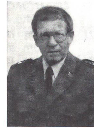
Brigadier, nebenamtlicher Kommandant der Feldtelegrafenen-/Feldtelefonbrigade 40 seit dem 1.1.1995

schule Frauenfeld und die Artillerie-Schiessschule für Kommandanten unterstellt. – In der Armee kommandierte er unter anderem das Festungsregiment 22 (1984 bis 1987). Er leistete Dienst als Generalstabsoffizier in der Grenzbrigade 12, der Gebirgsdivision 12 und der Reduitbrigade 22. EMD, Info