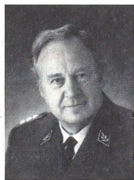
Korpskommandant, Generalstabschef der Schweizer Armee seit dem 1.1.1993

Unsere besten Wünsche mögen sie in die Zukunft leiten.