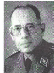
Brigadier, Oberauditor der Schweizer Armee seit 1. Oktober 1991