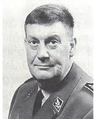
Brigadier, Kommandant Festungsbrigade 23 1.1.1991 bis 31.12.1997