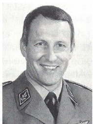
Brigadier, Stabschef Luftwaffe 1.1.1989 bis 31.12.1997