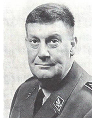
Brigadier, Kommandant Festungsbrigade 23 1.1.1991 bis 31.12.1997