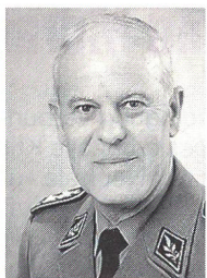
Divisionär, Kommandant Territorialdivision 9 vom 1.1.1992 bis 31.12.1997