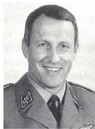
Brigadier, Stabschef Luftwaffe 1.1.1989 bis 31.12.1997