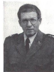
Brigadier, nebenamtlicher Kommandant der Feldtelegraphen-/Feldtelefonbrigade 40 seit dem 1.1.1995

schule Frauenfeld und die Artillerie-Schiessschule für Kommandanten unterstellt. – In der Armee kommandierte er unter anderem das Festungsregiment 22 (1984 bis 1987). Er leistete Dienst als Generalstabsoffizier in der Grenzbrigade 12, der Gebirgsdivision 12 und der Reduitbrigade 22. EMD, Info