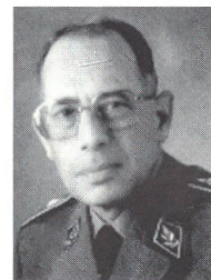
Brigadier, Oberauditor der Schweizer Armee seit 1. Oktober 1991