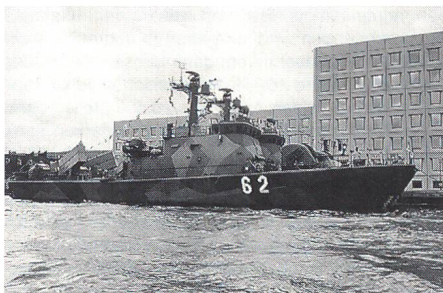
Die finnischen Schnellboote «Oulu» (62) und «Turku» (61) der «Helsinki»-Klasse

in Russland setzt China sein Bestreben fort, alte Schiffe durch qualitativ hochwertiges Material zu ersetzen. • Finnland • Auch die finnische Marine versieht seine Neuanschaffungen mit Stealth-Eigenschaften. Der Prototyp für eine Serie von bis zu acht