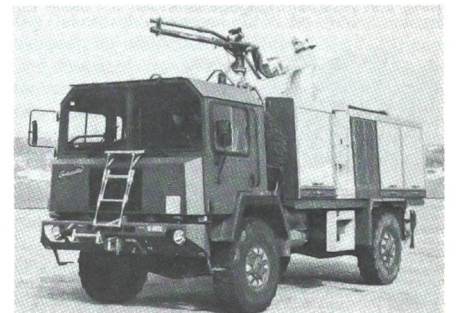
Der vielseitige Saurer 88 hat sich bereits bestens bewährt. Aus BAMF Info

Im September 91 wurde das letzte von insgesamt 20 neuen Löschfahrzeugen «Saurer 88» an die BAMF-Betriebe ausgeliefert, welche den Unimog STL 500 und das Schaumlösch-Fahrzeug GMC 53 ersetzen, die seit langen Jahren im Einsatz stehen. Besonders der Unimog STL 500 wurde infolge seiner Untermotorisierung stark überbeansprucht, was in letzter Zeit zu häufigen Defekten und Ausfällen geführt hat. Durchschnittlich dauert der Rüstungsablauf 10 Jahre. Bei der Beschaffung der 20 neuen Löschfahrzeuge mit der Kurzbezeichnung «SAURER 88» dauerte dieser Prozess etwas länger. Seit dem ersten Pflichtenheftentwurf im Mai 77 sind nun immerhin mehr als 14 Jahre vergangen.