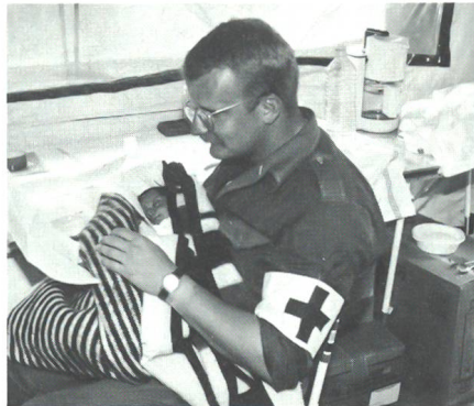
Österreichischer Sanitätssoldat im Feldspital in Iran 1991.