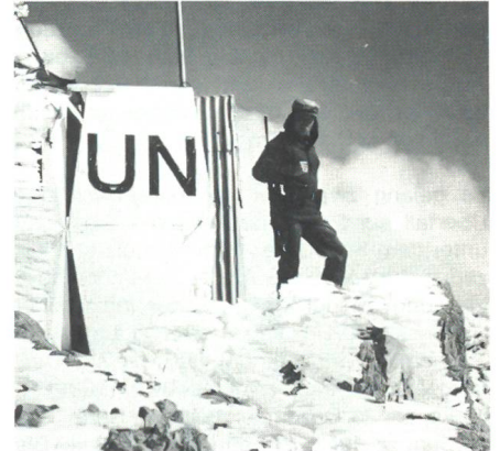
Wache der österreichischen Blauhelmtruppe auf den Golanhöhen.