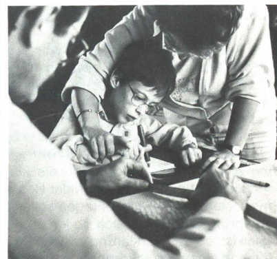
Cerebralgelähmtes Kind wird von den Eltern betreut: Die Stiftung für das cerebral gelähmte Kind setzt sich dafür ein, dass möglichst viele cerebral Behinderte zu Hause im Kreise der Familie betreut werden können.