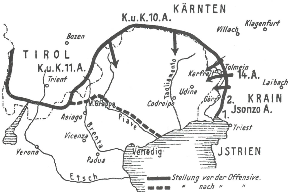
Der südwestliche Kriegsschauplatz und der Durchbruch bei Flitsch und Tolmein Ende Oktober 1917

Nach dem Beginn des Ersten Weltkrieges lag der Schwerpunkt des Krieges für das k u k Heer im Osten. Conrad hatte als Oberbefehlshaber und im Vertrauen auf die Zusage der deutschen Heeresleitung den Krieg gegen Frankreich und England mit der Durchführung des «Schlieffen-Planes» binnen sechs Wochen siegreich zu beenden und dann massiv auf dem Kriegsschauplatz im Osten einzugreifen, in den Aufmarschraum der russischen Armee hinein angreifen zu lassen. Die Sommer- und Herbstkämpfe in Galizien und der Karpatenwinter 1914/15, die trotz verzweifelter Einsatzversuche notwendige Kapitulation der Festung Przemysl, und die Kämpfe gegen Serbien hatten dem Heer der Donaumonarchie Verluste von mindestens 1,3 Millionen Mann an Gefallenen, Verwundeten und Gefangenen gekostet. Von diesem Aderlass sollte sich die k u k Armee nie wieder erholen. Erst im Frühjahr 1915 kamen starke deutsche Armeen auf dem Kriegsschauplatz im Osten wirkungsvoll zum Einsatz, wo sie mit