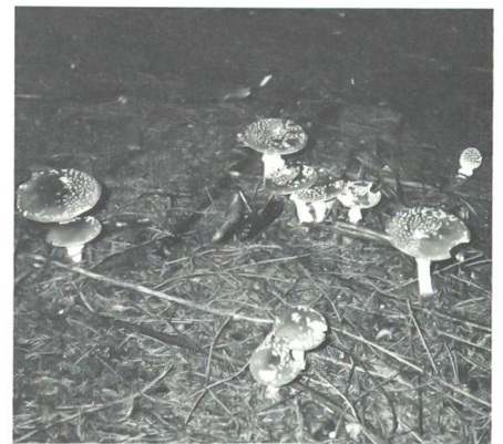
Fliegenpilze sprechen für sich.

Organisiert vom Militär-Sanitäts-Verein Olten fand am 19. Oktober 1991 der 9. Nordwestschweizer Distanz-