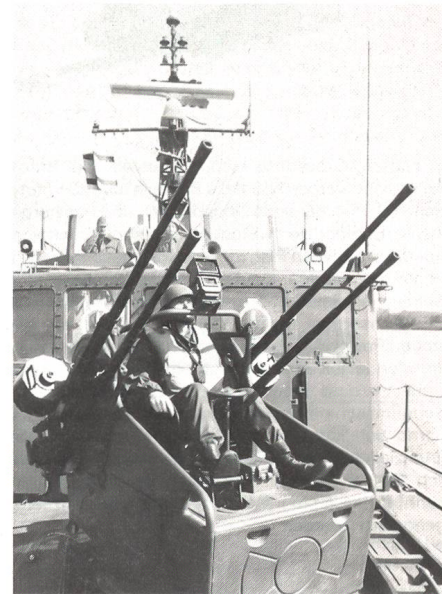
Die ungarische Donau-Flottille bei einer Übung.

Angesichts der heiklen strategischen Stellung Ungarns in Osteuropa, der Ablehnung der ursprünglich durch die Sowjets eingesetzten Streitkräfte durch die Bevölkerung und der problematischen Wirtschafts- und Finanzlage sind die Verantwortlichen des Landes heute mit der Frage über die Zukunft der Verteidigung konfrontiert. Dazu gehören auch die Fragen nach der Bildung einer Armee aus Freiwilligen und der Abschaffung der Wehrpflicht. Diesem Problem wurde während des Symposiums eine besondere Aufmerksamkeit geschenkt. Während die Befürworter vor allem die hohe Motivation und Ausbildung von Freiwilligenarmeen in den Vordergrund stellten, hielten ihnen die Gegner die Kosten und die geringe Grösse dieses Armeetyps vor. Weiter wurde das Vorhandensein einer Rekrutierungsbasis zum gegenwärtigen Zeitpunkt mit einem Fragezeichen versehen.