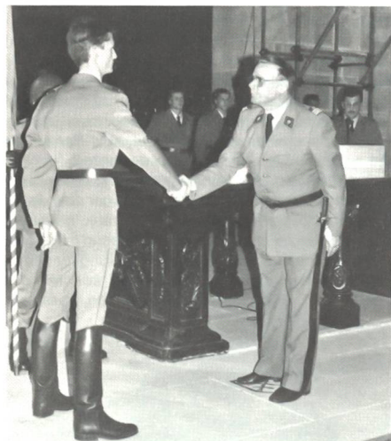
Der Schulkommandant, Oberst i Gst Stähli, befördert einen Train-Aspiranten zum eidgenössischen Leutnant der Infanterie.

107 Aspiranten der Infanterie-Offiziersschule 4/92 in Bern – Füsiliere, Schützen, Mitrailleure, Grenadiere, Minenwerferkanoniere, Gebirgsgrenadiere und Gebirgsmitrailleure sowie Train-Aspiranten – wurden zu kantonalen oder eidgenössischen Leutnants befördert. Vertreten waren unter den Aspiranten alle Deutschschweizer Kantone, Graubünden und das Wallis sowie (mit je einem Aspiranten) der Tessin und die Waadt. Es versteht sich daher von selbst, dass