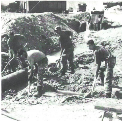
Aspiranten der Luftschutz-OS beim knochenharten Arbeitseinsatz im Bergsturzgebiet bei Randa.

Die 54 Aspiranten der in Wangen an der Aare domizilierten Luftschutz-Offiziersschule 1992 kamen im Rahmen der Durchhalteübung « Treize étoiles » im Walliser Mattertal zu einem ganz besonderen Arbeitseinsatz. Noch ist nicht alles « geflickt », was die 25 bis 30 Millionen Kubikmeter Gestein kaputt machten, die im Frühjahr 1991 in zwei Schüben beim 440 Einwohner zählenden Bergdorf Randa ins Tal donnerten. Damals wurde unter anderem auch der Richtung Hochkastel führende Bergwanderweg verschüttet. Nun haben ihn die angehenden Leutnants der Luftschutztruppen auf einer Länge von rund 600