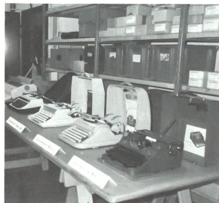
Von der ehemaligen «schwarzen Hermes» bis zu modernsten Modellen konnten alle besichtigt werden.

schichte gehe zu Ende. Der KMV-Direktor stellte die Frage in den Raum «Wie geht es weiter?» und gab mit Bestimmtheit auch gleich die Antwort: «Ganz sicher nicht in die Resignation.» Ob der geforderte Personalabbau bei der KMV vorzeitige Pensionierungen erfordern werde, hänge von der Entwicklung der jährlichen Fluktuationsrate ab. Hingegen werde die KMV alles daran setzen, den bis 1995 vorzunehmenden Personalabbau möglichst ohne Härtefälle wie z B durch Entlassungen zu realisieren. Der Redner zeigte sich in dieser Hinsicht optimistisch. Er kam aber