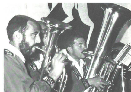
Die eigene Zeughausmusik spielte stramme Märsche.

kleinen, gespart werden muss, sprach das EMD für diesen Jubiläumsanlass keinen Kredit aus. Um so mehr darf der Betriebsleitung für das Gebotene Dank und Anerkennung ausgesprochen werden.