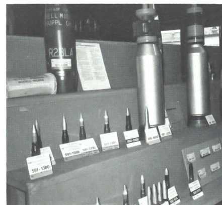
Geschosse aller Art wurden gezeigt.