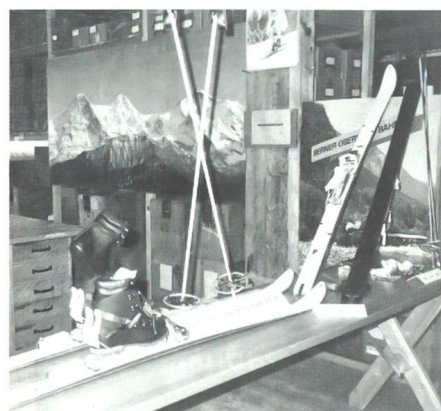
Der doppelte Skischuh fand besondere Beachtung. Im Hintergrund – wie könnte es anders sein – Eiger, Mönch und Jungfrau.

schichte gehe zu Ende. Der KMV-Direktor stellte die Frage in den Raum «Wie geht es weiter?» und gab mit Bestimmtheit auch gleich die Antwort: «Ganz sicher nicht in die Resignation.» Ob der geforderte Personalabbau bei der KMV vorzeitige Pensionierungen erfordern werde, hänge von der Entwicklung der jährlichen Fluktuationsrate ab. Hingegen werde die KMV alles daran setzen, den bis 1995 vorzunehmenden Personalabbau möglichst ohne Härtefälle wie z B durch Entlassungen zu realisieren. Der Redner zeigte sich in dieser Hinsicht optimistisch. Er kam aber