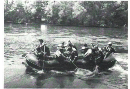
Die Patrouille des UOV Reiat im Einsatz...

hs. Ohne grosse Überraschungen endete am Aufahrtstag die 16. Reusstalfahrt des UOV Emmebrücke. Die ersten drei Plätze in der Rangliste wurden von den gleichen Vereinen belegt wie im letzten Jahr. Das