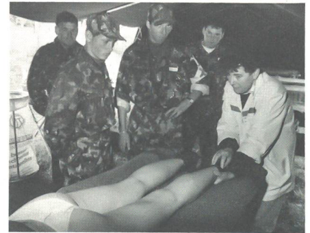
2x20, 30 oder gar 40 km sind eine anspruchsvolle Marschleistung. Auf die wirksame Hilfe der Sanität kann nicht verzichtet werden.

marsch keine individuellen Bestzeiten und Ranglisten, denn im Vordergrund steht das Motto «Wandern mit andern».