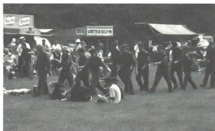
Viel Betrieb herrscht immer...