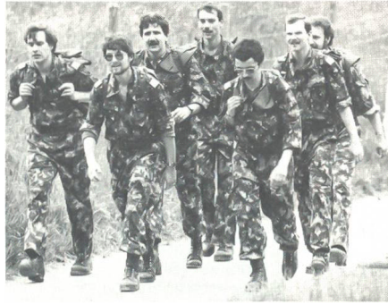
... und militärische Teilnehmer.

Bernischen Unteroffiziersverein führten dies damals auf das durchgehend schlechte Wetter vor und während des Marsches zurück, das zahlreiche Marschfreunde dazu bewog, ihre Anmeldung kurzfristig wieder rückgängig zu machen. Dieses Jahr herrschte nun weitgehend ideales Marschewetter. Dennoch, und trotz neuer, gemäss den Wünschen der Marschierenden geänderter Marschstrecke am Samstag nahmen bloss 4324 Marschbegeisterte aus der Schweiz (1991: 5097) und 1901 (2200) aus dem Ausland die erste Hälfte der zweimal 20, 30 oder 40 Kilometer unter die Füsse. Einen leichten Zuwachs verzeichnete einzig die Kategorie «Ausländisches Militär».