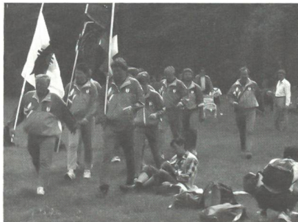
... an den offiziellen Rastplätzen.