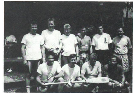
... und in Siegerpose.