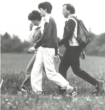
Am Schweizerischen Zweitagemarsch in Bern treffen sich zivile...

Bereits 1991 war die Teilnehmerzahl von rund 8000 auf knapp 7300 geschrumpft. Die Organisatoren vom