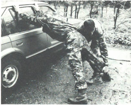
Am Trainingstag der Thurgauer Unteroffiziere wurde auch die Fahrzeug- und Personenkontrolle geübt.

waffentechnischen Disziplinen konnten sich die Übungsteilnehmer auf der Frauenfelder Allmend auch im Wachtdienst üben und dabei die Praktiken der Fahrzeug- und Personenkontrolle kennenlernen. Dabei zeigte es sich, dass es nicht immer ganz einfach ist, eine Person festzuhalten und nach verdächtigen Gegenständen abzusuchen.