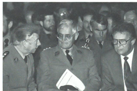
Prominente Gäste an der DV in Lenk (von links nach rechts): Div Carlo Vinzenz, KKdt J-R Christen (Ausbildungschef der Schweizer Armee), Regierungsrat Peter Widmer (Militärdirektor des Kantons Bern).

Auf Antrag des Unteroffiziersvereins Obersimmental war die Lenk als Tagungsort ausgewählt worden, weil dort im vergangenen März die 30. Durchführung des Wintergebirgs-Skilaufs (Zweitagemarsch auf Skis) unter dem Patronat des SUOV hatte gefeiert werden können. Die Organisatoren der DV zeigten sich posi-