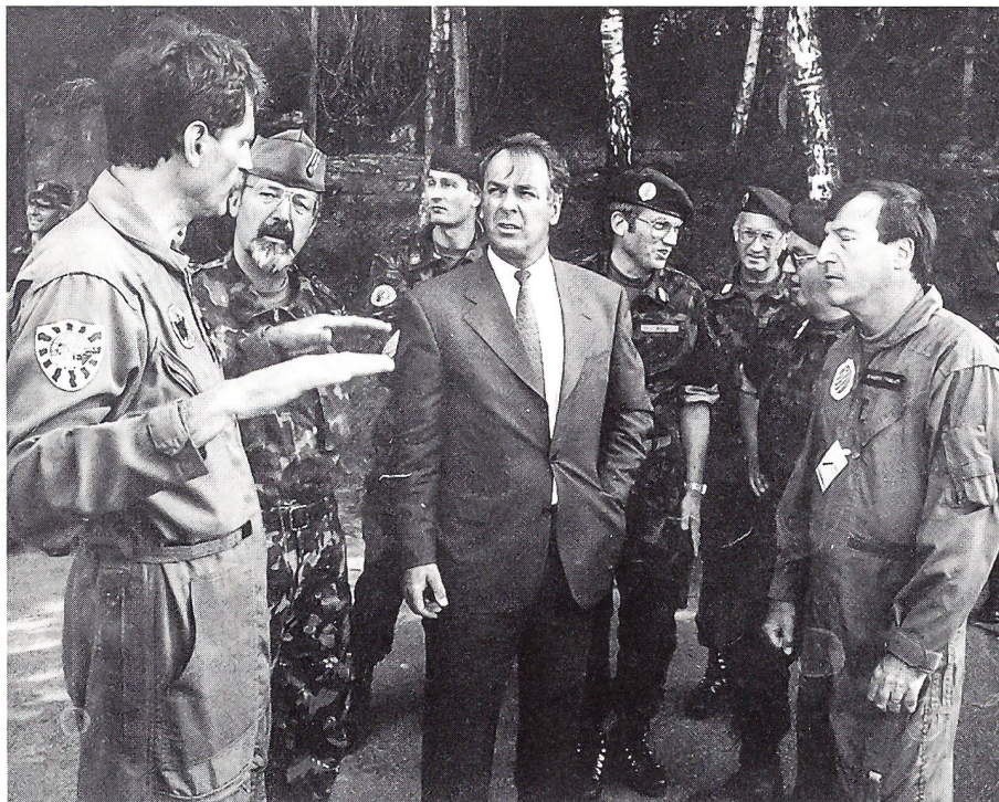
Bundesrat Adolf Ogi unterhält sich auf dem Militärflugplatz Turtmann mit der Truppe (Montag, 6. Mai 1996).

suchte er die Truppennähe, was ihm beinahe bis zur Vollkommenheit gelang. Die dort im Instruktionsdienst auf ihrem Militärflugplatz weilende Truppe, etwa 70 Offiziere und annähernd 800 Unteroffiziere und Soldaten, war zusehends erfreut über den Besuch des