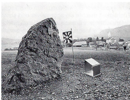
Die Gedenkstätte der Gz Br 5 am Waldrand oberhalb der Kirche Rein.

Rechtsstaat, wir sind ein Arbeitsplatz, wir sind dem sozialen und ökologischen Gedanken verpflichtet. Die Behauptung unserer Unabhängigkeit ist ein zentraler Wert unserer Rechts- und Wertordnung. Wer hier vorbeigeht, der soll an diese Realität erinnert werden.»