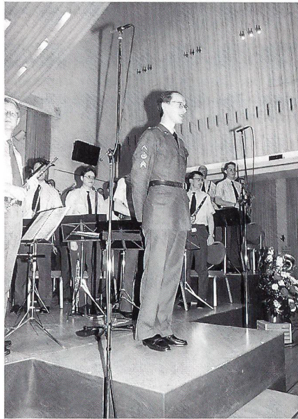
Der Spielführer und seine Musikanten nehmen den wohlverdienten Applaus.

nen, die Spielfreude und die Disziplin der Musikanten errudeten Dank in brausendem Applaus und zeigten dem Spielführer, dass er mit seinen Spielleuten auf dem rechten Weg ist.