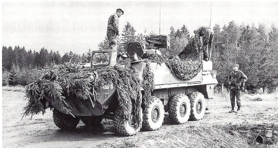
Der oft zitierte Radschützenpanzer 93 Piranha.

me bedeutet primär eine Investition in die intensivere Ausbildung der beteiligten Rekrutenschulen und der in der Folge schrittweise umzuschulenden mechanisierten Füsilierbataillone der Infanterieregimenter. Zudem konnten in nur drei Wochen wesentliche Erkenntnisse über Führung, Einsatz, Organisation und Mittel derartiger Truppenkörper gewonnen werden. Die zielgerichtete Verbesserung aller dieser Faktoren trägt mit dazu bei, die äussere Sicherheit unseres Landes kostengünstig zu verstärken.