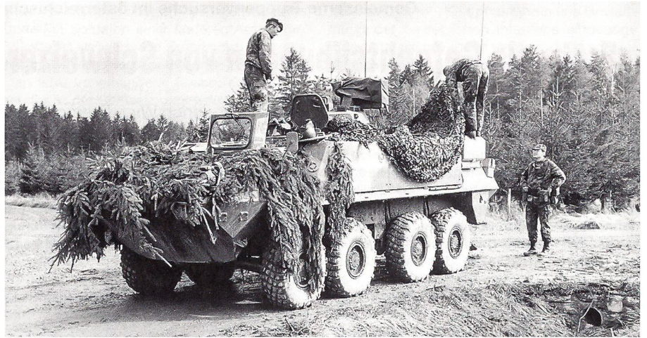
Der oft zitierte Radschützenpanzer 93 Piranha.

me bedeutet primär eine Investition in die intensivere Ausbildung der beteiligten Rekrutenschulen und der in der Folge schrittweise umzuschulenden mechanisierten Füsilierbataillone der Infanterieregimenter. Zudem konnten in nur drei Wochen wesentliche Erkenntnisse über Führung, Einsatz, Organisation und Mittel derartiger Truppenkörper gewonnen werden. Die zielgerichtete Verbesserung aller dieser Faktoren trägt mit dazu bei, die äussere Sicherheit unseres Landes kostengünstig zu verstärken.