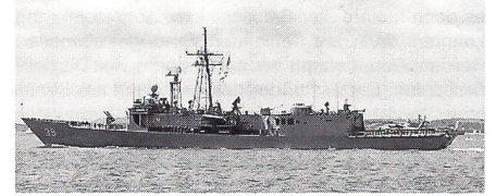
Die «USS Doyle» (FG 39), eine der 51 Fregatten des O.-Hazard-Perry-Klasse.

Frankreich bestellten Lenkflugwaffenfregatten in Dienst. Mit Ausnahme der Bewaffnung und des Sonars entspricht die 3500 t grosse «Kanding» weitgehend der französischen «Lafayette»-Klasse, deren augenfälligstes Merkmal die «Stealth»-Eigenschaft ist, dank der das Radarecho des Schiffes demjenigen eines 600 t grossen Patrouillenbootes entspricht. Für acht weitere Einheiten besitzt Taiwan eine Option. • USA • Weniger als sieben Jahre, nachdem die letzte Einheit der «Oliver-Hazard-Perry»-Klasse in Dienst gestellt worden ist, beginnt die US Navy bereits mit der Ausmusterung der Fregatten. Oman, Bahrain sowie