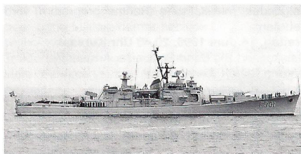
Norwegen möchte seine veralteten Fregatten, auf dem Bild die «Bergen» CF 301, ersetzen.

gatten der «Oslo»-Klasse um die Jahrtausendwende ersetzen zu können, holt Norwegen zurzeit bei verschiedenen nationalen und internationalen Werften Vorschläge für eine 2500 bis 3000 t grosse Fregatte ein. Norwegen plant, sechs Einheiten anzuschaffen. • Philippinen • In den nächsten 15 Jahren wollen die Philippinen im Ausland sechs Korvetten und zwölf grosse Patrouillenboote bauen lassen. Bisher bestand die philippinische Marine so gut wie ausschliesslich aus kleineren amerikanischen Einheiten aus dem Zweiten Weltkrieg, deren Limiten bereits bei den kleinen Scharmützeln um die von China beanspruchten Spratly-Inseln aufgedeckt wurden. • Spanien • Spanien hat für seine vier neuen Fregatten des Typs F-100 das amerikanische AEGIS-System als primäres Luftabwehrsystem gewählt und damit dem sich noch in Entwicklung befindlichen deutsch-holländischen APAR eine schmerzliche Absage erteilt. Beim AEGIS handelt es sich um das System, welches auf den amerikanischen Zerstörern der «Arleigh-Burke»-Klasse im Einsatz steht und den SPY-1D Radar umfasst. • Taiwan • Anfang Mai stellt die taiwanische Marine die erste von sechs in