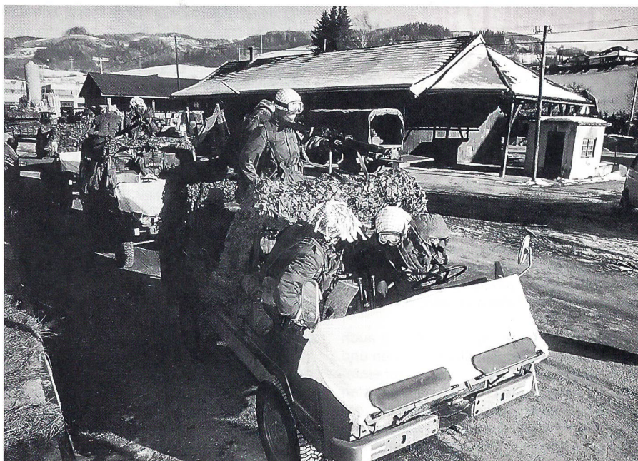
An der Abschlussübung des österreichischen IFOR-Kontingents

Die österreichische Einheit zählt zu dem «BELUGA-Kontingent», das aus 300 Soldaten aus Belgien, 60 Mann aus Luxemburg, 250 Griechen und den Männern aus Austria besteht. Es ist ein «historischer» Einsatz für die Leute aus der Donau-Alpen-Republik: Seit dem Ende des Zweiten Weltkrieges ist es das erste Mal, dass Österreicher wieder auf dem Balkan im Einsatz sind; diesmal als Friedensstifter. Sie wissen, wo immer sie der Befehl hinsendet, sie müssen den Nachschub an Kriegsmaterial und sonstigen Gütern in ganz Bosnien-Herzegowina aufrechterhalten. Trotz der Heckenschützen und Minen. Ihre LKWs wurden zu diesem Zweck mit Stahlplatten gehärtet, und sie selbst waren alle mit Splitter-