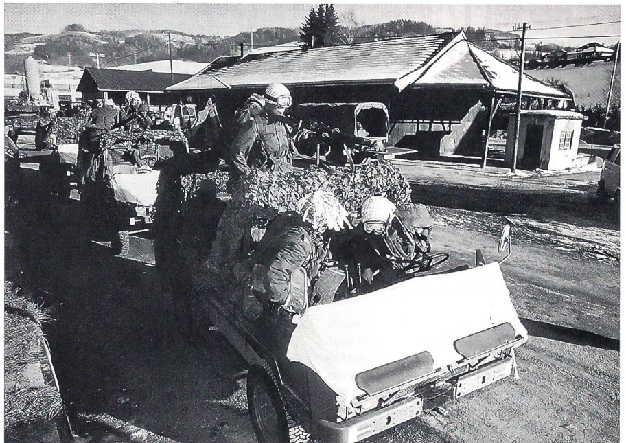
An der Abschlussübung des österreichischen IFOR-Kontingents

Die österreichische Einheit zählt zu dem «BELUGA-Kontingente», das aus 300 Soldaten aus Belgien, 60 Mann aus Luxemburg, 250 Griechen und den Männern aus Austria besteht. Es ist ein «historischer» Einsatz für die Leute aus der Donau-Alpen-Republik: Seit dem Ende des Zweiten Weltkrieges ist es das erste Mal, dass Österreicher wieder auf dem Balkan im Einsatz sind; diesmal als Friedensstifter. Sie wissen, wo immer sie der Befehl hinsendet, sie müssen den Nachschub an Kriegsmaterial und sonstigen Gütern in ganz Bosnien-Herzegowina aufrechterhalten. Trotz der Heckenschützen und Minen. Ihre LKWs wurden zu diesem Zweck mit Stahlplatten gehärtet, und sie selbst waren alle mit Splitter-