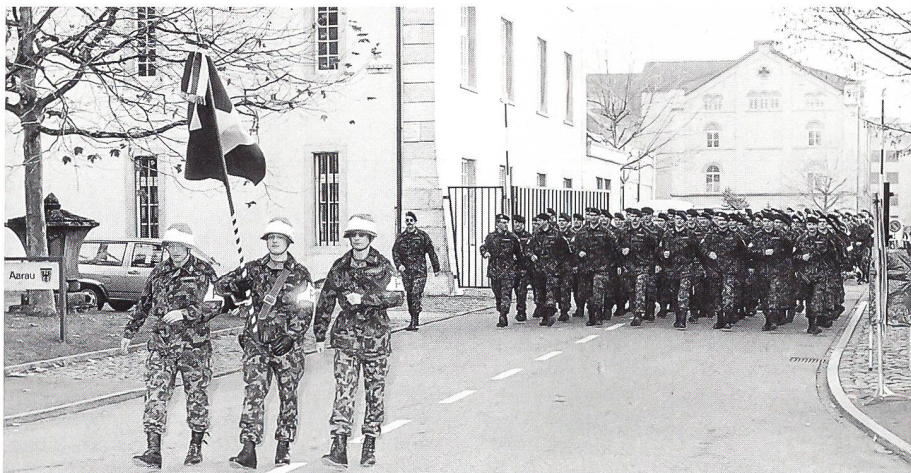
In Achterblocks, die Schweizer Fahne voran, marschierten die Offiziere des MP Bat 1, die Teilnehmer der Einführungskurse MP Of, MP Uof und Sdt sowie MP Gren von der Kaserne Aarau zur Stadtkirche. Die Tambourengruppe der Kantonspolizei Aargau stellte sicher, dass der grosse Harst von Militärpolizisten tip-top-tadellos durch die Altstadt marschierte.

Bis 1995 setzte sich die Mannschaft des MP