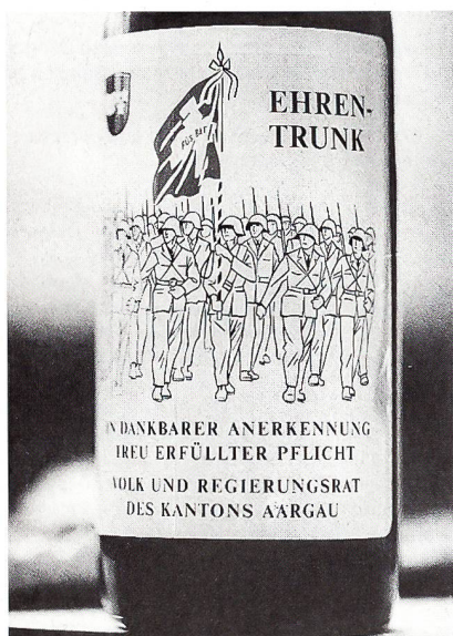
Aargauer Ehrentrunk mit unkorrektem Fahnengruss.