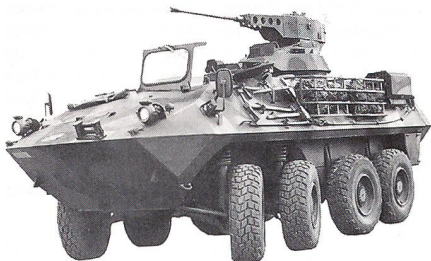
Der Radschützenpanzer 93 – gehört zu der weltweit bekannten Radpanzerfamilie MOWAG-PIRANHA

ebenfalls die Beschaffung von gepanzerten Radfahrzeugen vorsieht, von grossem Interesse. Der im Versuch angreifende Gegner wird durch eine mechanisierte Brigade des österreichischen Bundesheeres dargestellt. Den Verteidiger bilden zwei mit Radschützenpanzern 93 ausgerüstete Kompanien der Mechanisierten Infanterie-Rekrutenschule Bière (Mech Inf RS 1/96). Die Verwendung modernster Schiesssimulatoren für alle zum Einsatz gelangenden Waffensysteme ermöglicht eine realistische Durchführung der Gefechtseinsätze. Für die lückenlose Auswertung der Gefechtergebnisse werden umfangreiche, zum Teil EDV-unterstützte Mittel verwendet.