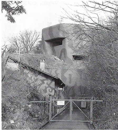
Festungseingang mit Beobachtungsturm 2.