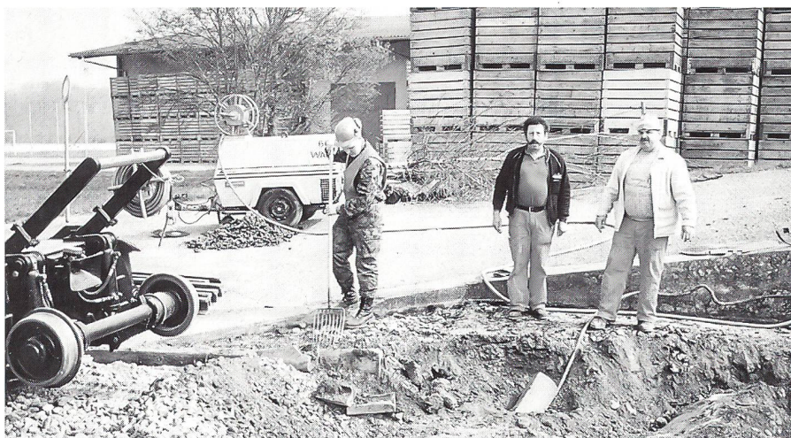
Auf der Baustelle arbeiten zivile Bauarbeiter und Militärangehörige eng zusammen.