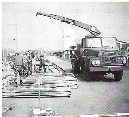
Rekruten an der Arbeit.

ist in Feuerthalen untergebracht und versorgt sich mit einer eigenen Küchenmannschaft selber. Ihre anderen Kollegen der Kompanie sind in der Kaserne geblieben und führen von dort Arbeiten in der Region Baden aus.