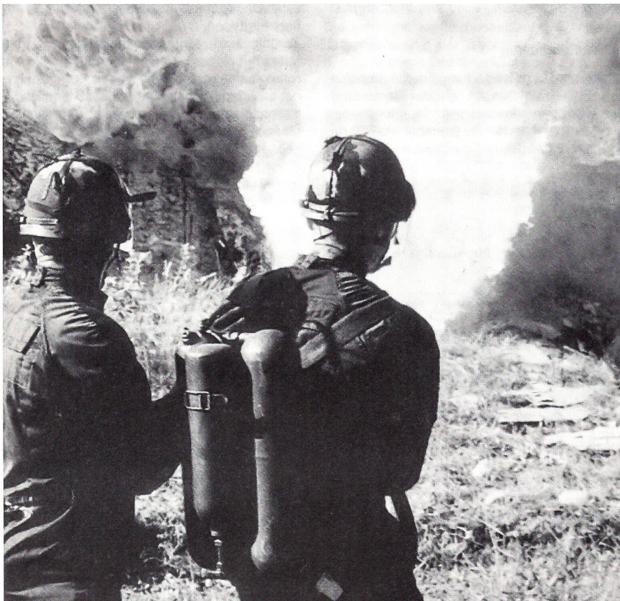
«Tir au lance – flammes pour ouvrir la voie aux fantassins.» Ausbildung der französischen Legionäre.

Militärisch auftragsorientierte Überlegungen bestimmen die Ausrüstung der Militärpolitisten und Territorial-Füsiliere mit Schlagstöcken, Handschellen und Tränengasgewehren. Die Rechtsgrundlagen von der Bundesverfassung und vom neuen Militärgesetz sind dafür eindeutig. Hier gilt es den ideologisch getragenen politischen Versuch der Schwächung unserer Soldaten im Ordnungsdienst von «links» abzublocken.