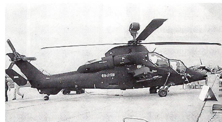
Premiere vor Publikum: Prototyp des Kampfhelikopters Eurocopter Tiger

fighter 2000 zeigte sich der Öffentlichkeit erstmals im Flug. Das von Deutschland, Grossbritannien, Spanien und Italien gemeinsam in Entwicklung stehende und politisch umstrittene Projekt wird noch dieses Jahr Schlagzeilen machen, wenn die Parlamente über den Serienbau befinden müssen. In Berlin wurde der deutsche Prototyp DA1 gezeigt, der im März 1994 seinen Erstflug unternommen hatte und bis heute rund 50 Stunden geflogen ist.