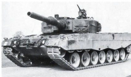
Der Panzer 87 («Leopard 2»), die Hauptbewaffnung der Panzerbrigaden.

Die Armee-Panzerbrigaden müssen somit gegebenenfalls auch im Verbund mit den Panzerbrigaden der Armeekorps eingesetzt werden können. Die Panzerbrigade 2 ist deshalb