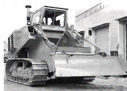
Schürfraupen Die wirtschaftliche Methode für Massenbewegungen

CH-8401 WINTERTHUR Tel. 052-213 30 23 Fax 052-213 00 29 D-78224 Singen D-13156 Berlin A-6900 Bregenz Rundstrasse 25 Aus dem Ausland: Tel. 0041-52-213 30 23 Fax 0041-52-213 00 29