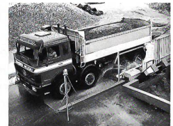
MOBY DICK Reifenwaschanlagen und Radreinigungsanlagen für LKWs