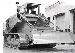
Schürfraupen Die wirtschaftliche Methode für Massenbewegungen

CH-8401 WINTERTHUR Tel. 052-213 30 23 Fax 052-213 00 29 D-78224 Singen D-13156 Berlin A-6900 Bregenz Rundstrasse 25 Aus dem Ausland: Tel. 0041-52-213 30 23 Fax 0041-52-213 00 29