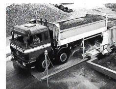
MOBY DICK Reifenwaschanlagen und Radreinigungsanlagen für LKWs