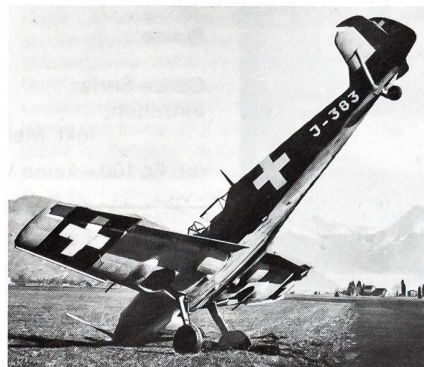
Kopfstand bei der Landung einer Messerschmidt.

Ein zweites, zwar privatwirtschaftliches Unternehmen, das sich direkt in den Dienst der Landesverteidigung stellte und bei Kriegsbeginn seine Tätigkeit in Stans aufnahm, sind die von Georg Emil Bührle und Antoine Gazda im Jahr 1939 gegründeten Flugzeugwerke «Pilatus» in Stans, die 1941 in Betrieb gingen. Das erste in der «Pilatus» gebaute Flugzeug war die SB-2 Pelikan, die sich für Transport- und Vermessungseinsätze in Gebirgsregionen eignete und ab 1944 zum Einsatz kam. In den ersten Jahren des Zweiten Weltkrieges bemühten sich die «Pilatus Flugzeugwerke» um die Lizenzrechte für den Nachbau eines italienischen und eines deutschen Trainingsflugzeuges. Als diese Pläne scheiterten, wagte man sich an die Entwicklung eines eigenen Prototypen – des Trainingsflugzeuges P-2. Das dritte militärische Grossprojekt in der Region bildete der Bau der Festung Fürigen in Stansstad, die heute ein eigenes Museum innerhalb der Nidwaldner Museen ist. Die Festung Fürigen wurde am 26. Oktober 1942 fertiggestellt. Die beiden Artilleriegeschütze als Kern der Anlage sicherten das durch Lopper und Bürgenberg geformte Enghis der Brüniglinie, die als eine der Hauptachsen vom Mittelland ins Alpenreduit führte. Die Festung wurde 1987 aufgegeben. Sie kann auf Anmeldung