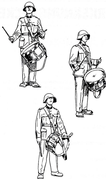
Tragart der Ordonnanztrommel und Schlegelhaltung.

Zahl unter die Trommler und Pfeifer mischten, die im Anschluss an die alljährlichen Waffeninspektionen in Zügen durch die Stadt Basel marschierten, und weil auch die Umzüge der Zünfte und der Kleinbasler Ehrengesellschaften sowie die Fronleichnamsprozessionen von Trommlern und Pfeifern begleitet wurden. Entscheidende Impulse gingen dann von den französischen Garnisonstruppen 1798 und den «Tambour-Maitres» aus, die nach der Auflösung der napoleonischen Heere 1815 in der Stadt einen günstigen Wirkungskreis fanden. Einen wichtigen Beitrag zur Ausgestaltung der Basler Trommler leisteten ebenfalls die sogenannten «Stänzler», Standestruppen der Stadt. Auch Anlässe wie der Vogel Gryff, Zunftbesuche, feierliche Empfänge und schweizerische Schützen- und Turnfeste gaben Gelegenheit zum Auftreten. All das trug dazu bei, dass die Basler Trommlerkunst in der ersten Hälfte des 20. Jahrhunderts zu einem eigentlichen Siegeszug durch die Schweiz ansetzen und entscheidende Anstöße zur Weiterentwicklung geben konnte: 1906 schlossen sich die vielen Ende des 19. Jahrhunderts entstandenen lokalen Tambourvereine zum Schweizerischen Tambourverband zusammen. Führende Tamboursektionen wurden Luzern, Solothurn, Gossau, Winterthur, Wil und Domat/Ems. Erfreulicherweise bildeten sich auch im Oberaargau zahlreiche Vereine und