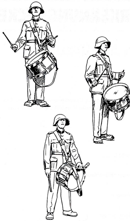
Tragart der Ordonnanztrommel und Schlegelhaltung.

Zahl unter die Trommler und Pfeifer mischten, die im Anschluss an die alljährlichen Waffeninspektionen in Zügen durch die Stadt Basel marschierten, und weil auch die Umzüge der Zünfte und der Kleinbasler Ehrengesellschaften sowie die Fronleichnamsprozessionen von Trommlern und Pfeifern begleitet wurden. Entscheidende Impulse gingen dann von den französischen Garnisonstruppen 1798 und den «Tambour-Maitres» aus, die nach der Auflösung der napoleonischen Heere 1815 in der Stadt einen günstigen Wirkungskreis fanden. Einen wichtigen Beitrag zur Ausgestaltung der Basler Trommler leisteten ebenfalls die sogenannten «Stänzler», Standestruppen der Stadt. Auch Anlässe wie der Vogel Gryff, Zunftbesuche, feierliche Empfänge und schweizerische Schützen- und Turnfeste gaben Gelegenheit zum Auftreten. All das trug dazu bei, dass die Basler Trommlerkunst in der ersten Hälfte des 20. Jahrhunderts zu einem eigentlichen Siegeszug durch die Schweiz ansetzen und entscheidende Anstöße zur Weiterentwicklung geben konnte: 1906 schlossen sich die vielen Ende des 19. Jahrhunderts entstandenen lokalen Tambourvereine zum Schweizerischen Tambourverband zusammen. Führende Tamboursektionen wurden Luzern, Solothurn, Gossau, Winterthur, Wil und Domat/Ems. Erfreulicherweise bildeten sich auch im Oberaargau zahlreiche Vereine und