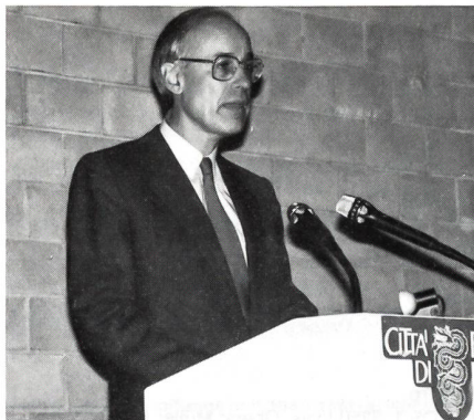
Regierungspräsident des Kantons Tessin, Renzo Respini.

Am 21. Oktober 1994 war es endlich soweit. Nach 17 entbehrungsreichen Ausbildungswochen wurden die 77 Absolventen der Übermittlungs- und Feldtelegrafenschule Bülach in Bellinzona zu Leutnants befördert. Die eindrucksvolle Feier wurde mit teils hochstehenden Vorträgen des Geb Inf