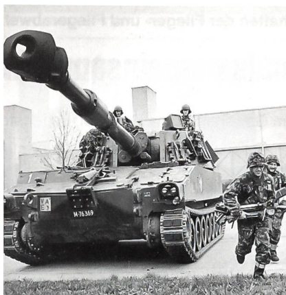
Drillmässiger Stellungbezug eines Einzelgeschützes

In der ersten WK-Woche stand denn auch die Ausbildung am Einzelgeschütz im Vorder- grund. In der zweiten Woche bildeten Übun- gen im Batterie-Rahmen auch ausserhalb des Waffenplatzes Auenfeld den Schwerpunkt. In der dritten Woche war eine dreitägige Übung der ganzen Abteilung mit Verschiebung in die