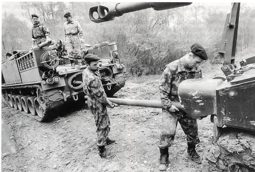
Eine steckengebliebene Panzerhaubitze wird von Spezialisten der Dienstbatterie geborgen

In diesem Jahr stand für die Formation der erste dreiwöchige WK auf dem Programm mit Standort Waffenplatz Auenfeld in Frauenfeld. Doch nicht nur das hat sich geändert. Die vormaligen «36er» hatten bis auf etwa einen Fünftel ihre Dienstpflicht erfüllt. Die Ab-