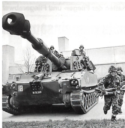
Drillmässiger Stellungbezug eines Einzelgeschützes