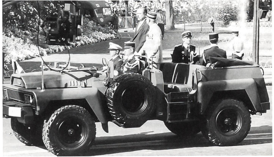
Der Präsident der République Française JACQUES CHIRAC mit dem Chef des Armeestabes und Militärgouverneur von Paris, Général d'Armée GUIGNON. Das Fahrzeug ist ein VLRA (Véhicule de Transport Multifonction, Dieselmotor 125 PS).

Die am 1. Mai 1803 gegründete Schule wurde am 22. April 1914 mit einer der höchsten Auszeichnungen Frankreichs dekoriert, und zwar mit der Légion d'Honneur . (Auf den Schlachtfeldern des Ersten Weltkrieges fielen über 5000 Saint-Cyriens).